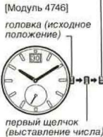
[Модуль 4746] головка (исходное положение), первый щелчок (выставление числа)