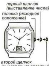
головка (исходное положение), первый щелчок (выставление числа), второй щелчок (выставление времени)