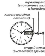
головка (исходное положение), первый щелчок (выставление числа и дня недели)