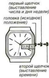
головка (исходное положение), первый щелчок (выставление числа и дня недели)